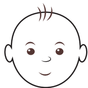
Primera photo del bebé

¡Solicite los resultados de las pruebas de detección neonatal de su bebé en su siguiente cita médica