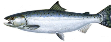
Coho salmon *