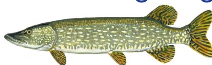
Northern pike *