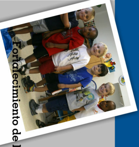
Fortalecimiento de la Familia

La Casa de Christamore entiende que muchos de nuestras familias viven en pobreza y otros corren el riesgo de quedar sin hogar. Como resultado, el departamento de apoyo familiar usa un nuevo modelo llamado el centro para familias trabajadoras (CWF). Este modelo es un esfuerzo para satisfacer las necesidades de nuestras familias y últimamente es una manera en que ellas pueden lograr a tener autonomía económica. Los servicios que brindamos incluyen: suministro de prendas de vestir y comida de emergencia, suministros infantiles, asistencia con facturas de servicios públicos, y el entrenamiento financiero. En adición, el departamento de apoyo familiar tiene la capacidad de hacer referencias a otras organizaciones asociadas las que proveen servicios como el consejo de salud mental, auxilio de violencia doméstica, ayuda con su salud, y otros servicios que La Casa de Christamore no ofrece.